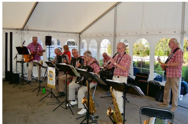
Sätrabälgarna höll igång firandet långt in på kvällstimmarna.