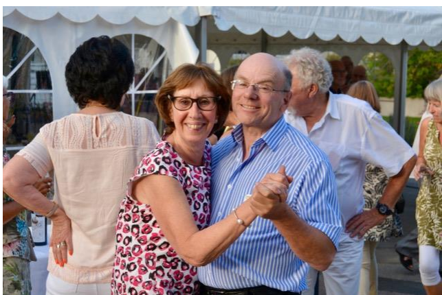
Inte varje dag man får chansen att dansa under öppen himmel till live musik.