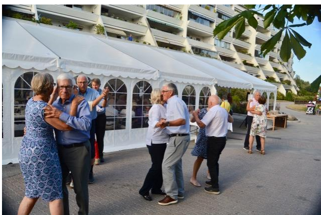
Många passade på att dansa till den härliga musiken.