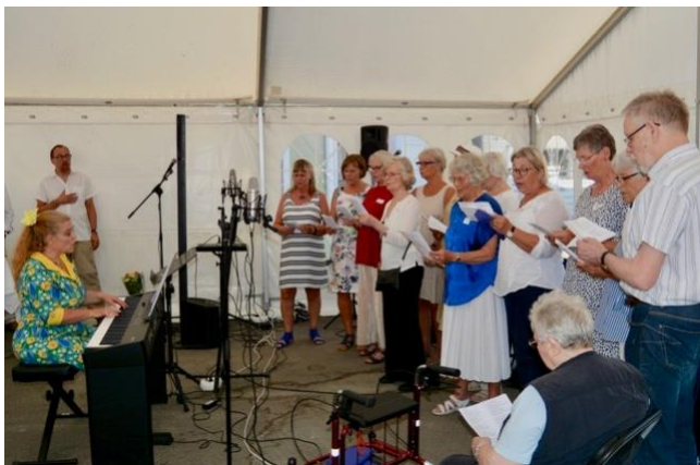
Akvarellens egna kör uppträdde på firandet.