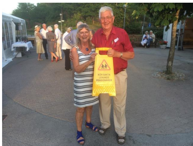
Två av många "lekande pensionärer".